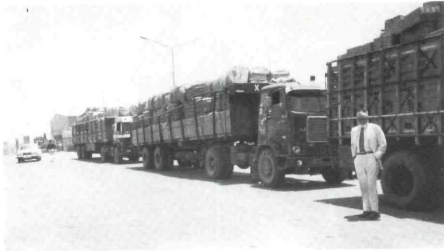
Juin 1982 : les premiers secours arrivés par avion de Copenhague, magasin central de l'UNICEF, sont dirigés par convoi sur Beyrouth assiégée.