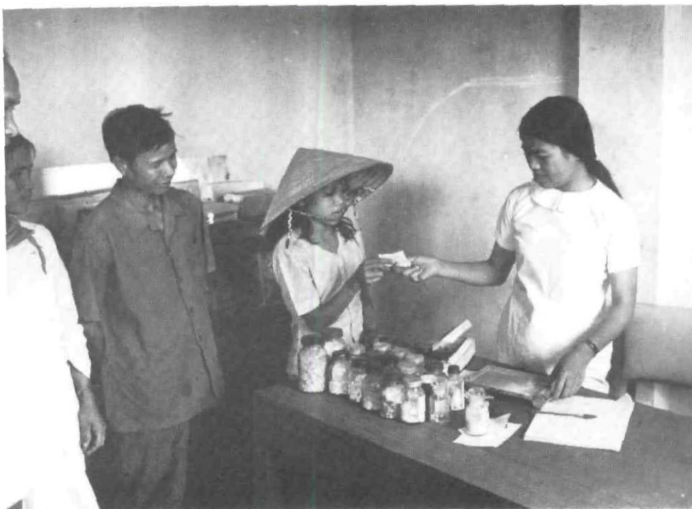
Dans un centre de santé communal, un volontaire du Service de Santé donne des médicaments à une jeune Vietnamiennne..

Les photos non signées relèvent des reportages de l'UNICEF et des collections de l'auteur.