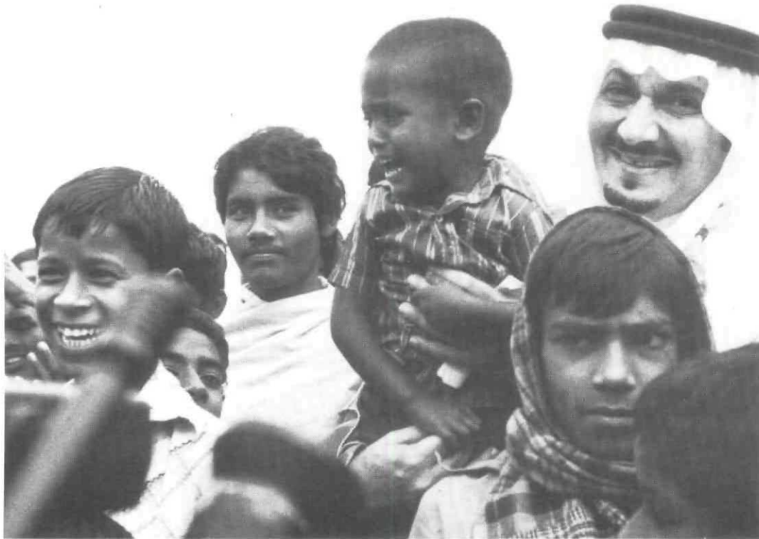
Le prince Talal bin Abdul-Aziz Ibn Séoud découvre les enfants du Bangladesh.