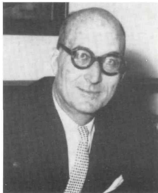
Georges Sicault, créateur d'une des premières politiques de santé publique du tiers monde, lorsqu'il était directeur général au temps du protectorat au Maroc en 1956.