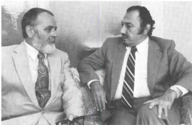
1981, le prince Talal bin Abdul-Aziz Ibn Séoud s'entretient avec le Dr F. Remy de la création de l'A.G.F.U.N.D. (Fondation des États arabes du Golfe pour le développement).