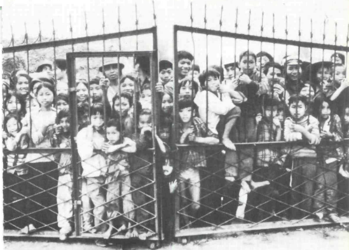
Hanoi, 1976 : « Dans un pays en voie de développement, l'objectif c'est la vie. »