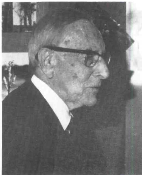
Le Pr Robert Debré, un des doyens du conseil d'administration de l'UNICEF.