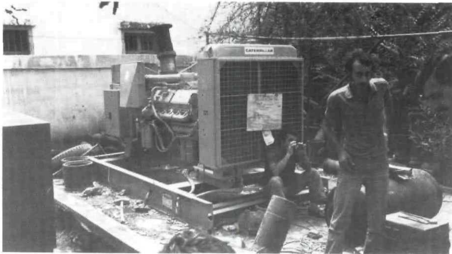
Juin-juillet 1982, dans le faubourg sud de la banlieue de Beyrouth : la station de pompage a été détruite par les bombardements aériens, les réservoirs sont vides. Ce groupe permettra de pomper sous la ville et de remplir des réservoirs mobiles ou placés sur les toits des immeubles.